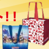
※写真はイメージです。種類は選べません。

すでにコストコ会員で倉庫店をご利用されている皆様も、「会員特典」として『ホットドック』&『ショッピングバック』をそれぞれ500名様にプレゼントいたします。 下記掲載の「引換券」を切り取り、必要事項をご記入いただき、引換券を下記チケットに記載の場所へお渡しください。(お一人様各1枚限り有効) ※定数に達した時点で特典終了となります。