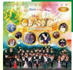
Presentation licensed by Disney Concerts. ©Disney