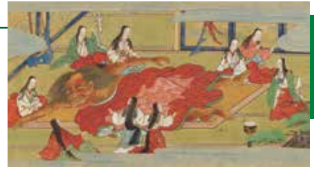
重要文化財 酒伝童子絵巻(部分) 狩野元信 三巻のうち下巻 大永2年(1522) サントリー美術館【通期展示】

本展では、近年修理を終えたサントリー本を大公開するとともに、そこから広がる酒呑童子絵巻の多様な展開をご紹介します。