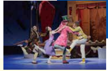
Alice's Adventures in Wonderland© by Christopher Wheeldon

【日時】 6月21日(土)午後1:00 【料金】 S席 15,300円 (一般料金 18,150円) 【場所】 新国立劇場 オペラパレス 【申込受付日】 4月8日(火) 【枚数】 10枚 【チケット引換期間】 6月2日(月)～6月6日(金) ※4歳未満入場不可