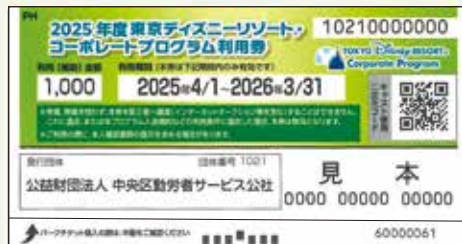
コーポレートプログラム利用券

東京ディズニーランド®/東京ディズニーシー®のパークチケットの購入やディズニーホテル宿泊にご利用いただける利用券です。