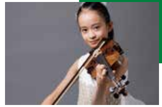
HIMARI: ©Hitoshi Iwakiri

【出演】ジョナサン・ノット(指揮 音楽・芸術監督) HIMARI(ヴァイオリン) スイス・ロマンド管弦楽団 【曲目】ジャレル:ドビュッシーによる3つのエチュード シベリウス:ヴァイオリン協奏曲 二短調 op.47 ストラヴィンスキー:バレエ「春の祭典」