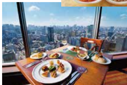
アーティストカフェ