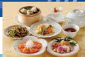
後樂園飯店 ※写真はイメージです。