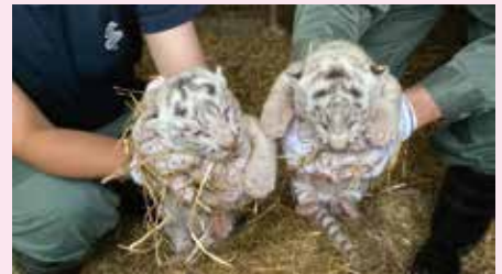
※写真はイメージです。

本券でポニーライド、特別催事(わんこビレッジ、VR等)、 コインマシンはご利用いただけません。