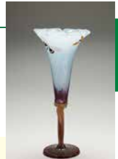
星顔形花器「蛾」 エミール・ガレ 1900年 サントリー美術館

エミール・ガレ(1846-1904)はフランス北東部の古都ナンシーに生まれ、ガラス・陶器・家具において独自の世界観を展開し、名声を極めました。ナンシーの名士として知られる一方、ガレ・ブランドの名を世に知らしめ、彼を国際的な成功へと導いたのは、芸術性に溢れ、豊かな顧客が集う首都パリでした。ガレの没後120年を記念する本展では、ガレとその国際的地位を不動のものとしたパリとの関係に焦点を当て、彼の創造性の変遷を顧みます。