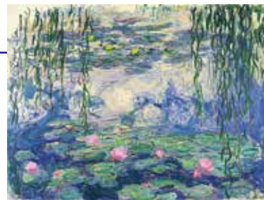
クロード・モネ《睡蓮》1916-1919年頃 油彩／カンヴァス マルモッタン・モネ美術館、パリ

印象派を代表する画家のひとりとして親しまれる、クロード・モネ。その晩年の制作に焦点をあてた本展では、マルモッタン・モネ美術館の珠玉のコレクションおよそ50点に加え、日本国内に所蔵される名品の数々から、“印象派を超えた”モネの芸術の豊かな展開をたどります。なかでも注目なのは、〈睡蓮〉の大画面に取り囲まれ、たゆたう水と一体になるかのような展示空間。ぜひ会場で、画家がその長い道のりの果てにたどり着いた境地をご堪能ください。