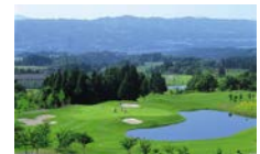
あてま高原リゾートベルナティオ ゴルフコース