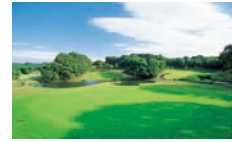
日立高鈴ゴルフ倶楽部