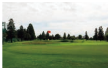
大宮カントリークラブ