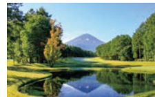
富士桜カントリー倶楽部