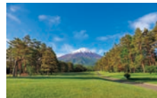
富士レイクサイドカントリー倶楽部