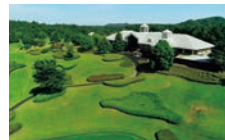
サザンヤードカントリークラブ