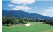
レイク相模カントリークラブ